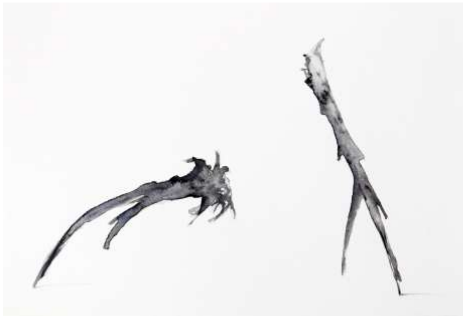
Disegno Preparatorio ( Solitaire ), 2016 Inchiostro e acquarello su carta